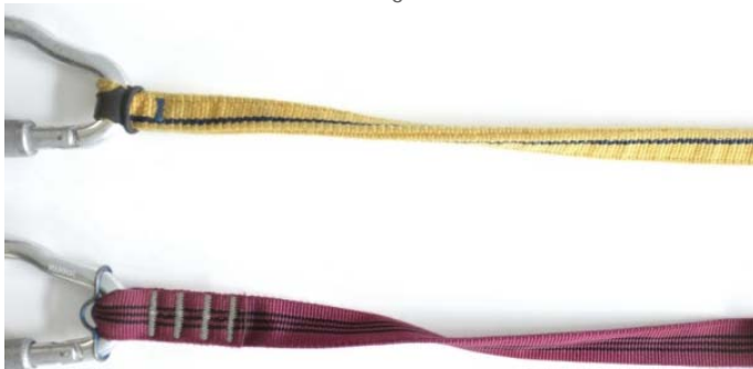
Nicht betroffen: nicht elastische Set-Äste

Klettersteigsets mit nicht elastischen Ästen sind von dem entdeckten gefährlichen Mangel nicht betroffen. Wie man elastische von nicht elastischen Sets unterscheidet, zeigen die beiden Bilder.